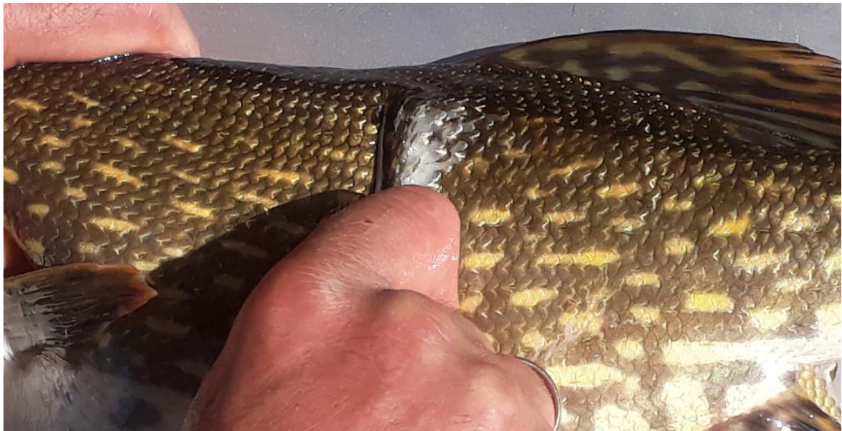
Entnahme einiger Schuppen zur Altersbestimmung

Um das Alter der Hechte bestimmen zu können, wurden unterhalb der Rückenflosse von jedem Hecht ein paar Schuppen entnommen. Diese Stellen dienen auch als Anhaltspunkt für einen markierten Hecht.