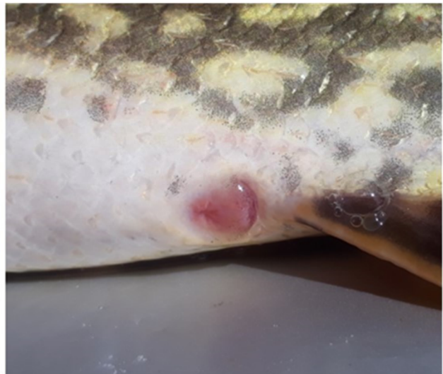
Links: Geschlechtsöffnung männlicher Hecht. Rechts: Geschlechtsöffnung weiblicher Hecht.

In der unten angeführten Liste sind alle markierten Hechte des Jahres 2021 unter Angabe der Totallänge, des Geschlechts und der Visible Implant Tag - Nummer aufgelistet. Die Hechtlängen wurden Ende März bzw. Anfang April erhoben und werden im Laufe des Jahres natürlich zunehmen.